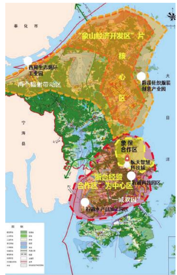
象山工业“一区六园”布局图

针对不同行业,我县分门别类加强排摸,鼓励企业以“点、线、面”三种方式开展智能化改造。“点”上抓单台设备改造,推动企业“机器换人”;“线”上抓生产线升级,开展自动化成套装备生产线改造;“面”上抓系统集成,开展智能工厂(数字化车间)建设示范。2017年,我县推广应用机器人80余台,乐惠国际的智能可移动精酿啤酒生产线入围省内首台(套)产品。锦浪新能源、戴维医疗获评市智能装备重点优势企业,云采网络和锦浪新能源列入市标杆企业。全年完成技术改造投资35.9亿元,29个工业投资(技术改造)项目列入市计划,获得市级预拨资金4370万元。