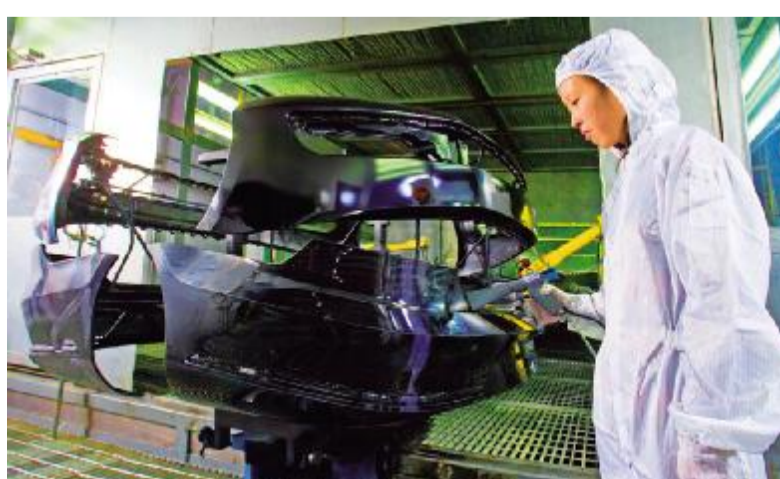
企业主动实施智能制造项目

“工欲善其事必先利其器,做大做强工业经济,培育增量很重要。”自去年,我县抓项目、攻难点,切实扩大工业有效投资。建立亿元以上项目库,详细列出基本情况、计划进