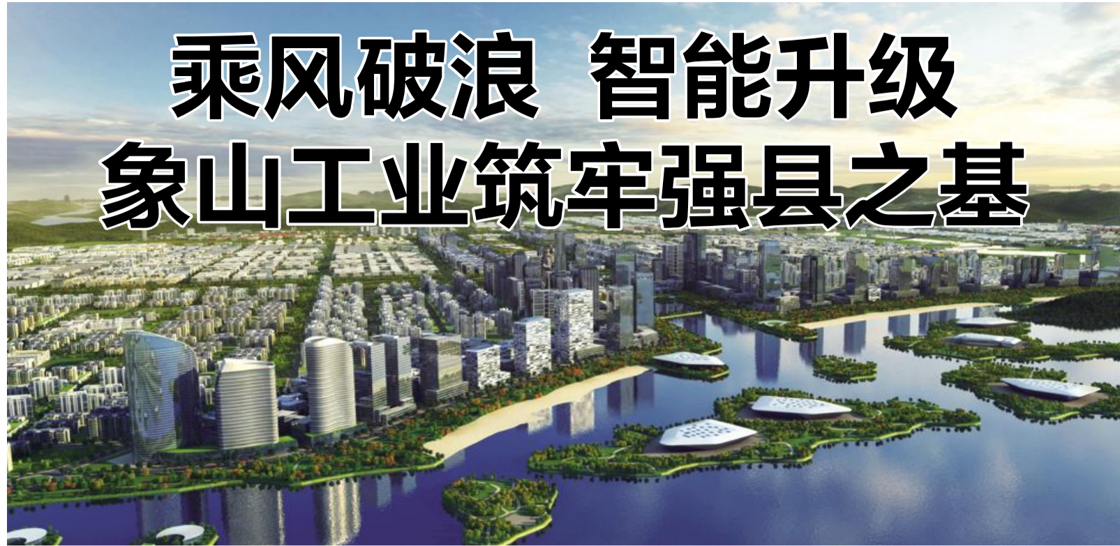
象保合作区航天智慧科技城争创国家云制造示范基地