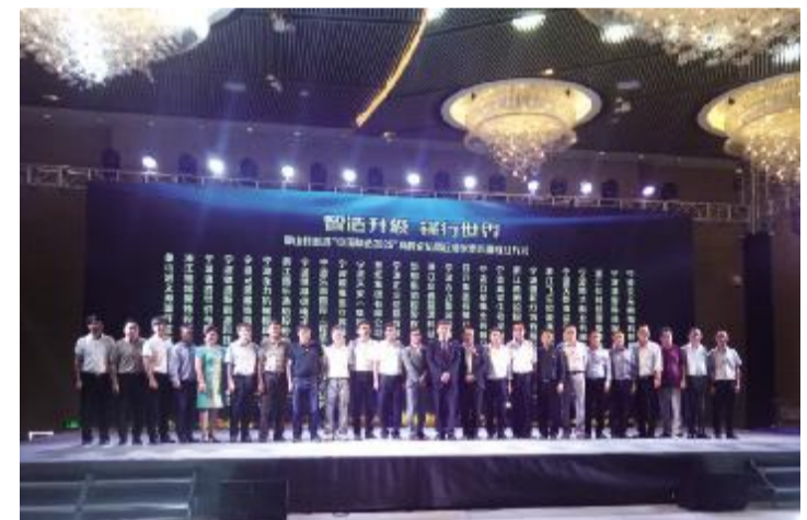
企业家俱乐部发起五年“三翻”倡议

在经过行业龙头骨干企业、高成长企业、单项冠军、“三名”企业和小微企业三年成长培育计划等一些分类培育动作后,我县的企业培育得到质和量的全面突破。乐惠国际、合力模具主板成功上市,戴维医疗、华翔特雷姆等44家企业相继获得国家、省市单项冠军,市行业龙头骨干、市高成长企业、市第三批“三名”培育试点企业、省小升规创业之星等荣誉称号。