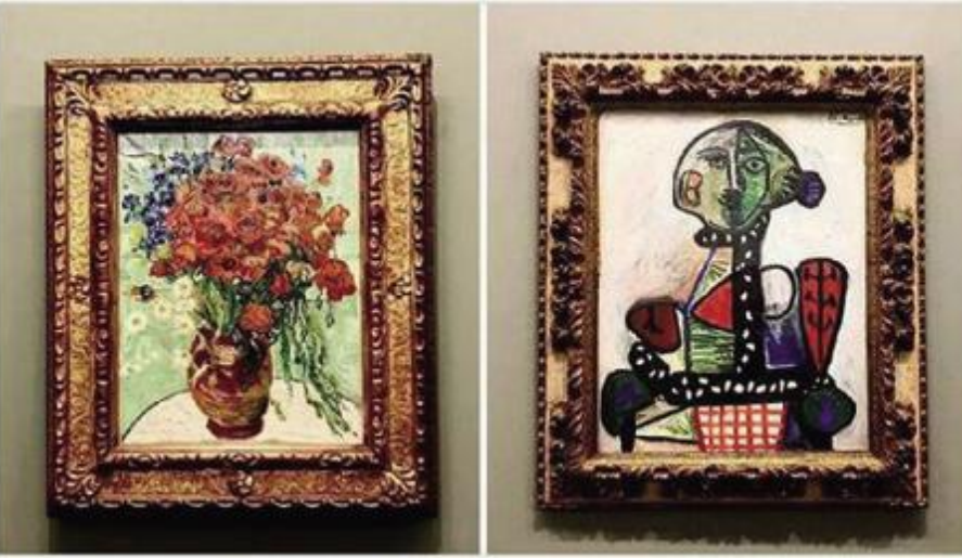
▲《雏菊与罂粟花》(左)《盘发髻女子坐像》(右)