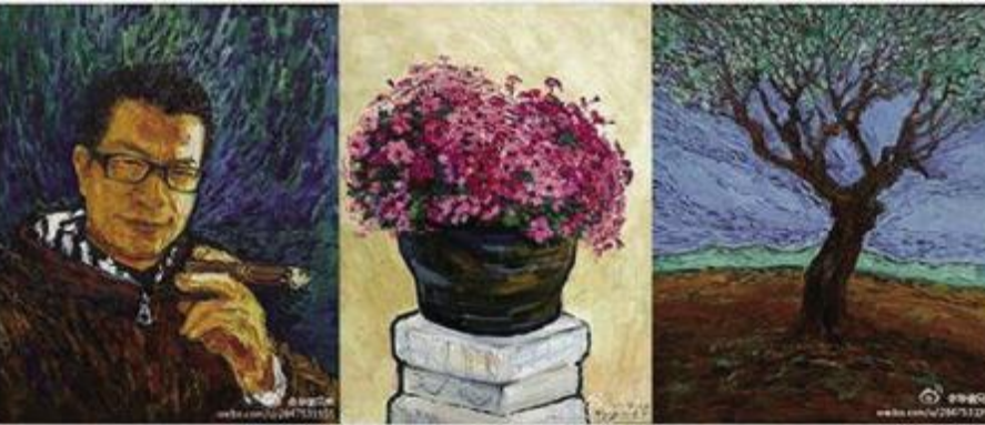
▲“中军和他的朋友们”部分画展