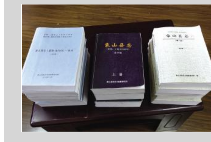
2019版县志的初审稿、复审稿和终审稿